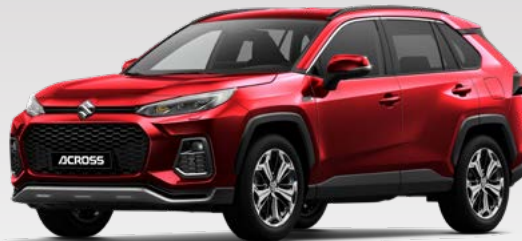
Sensual Red Mica (3T3)*