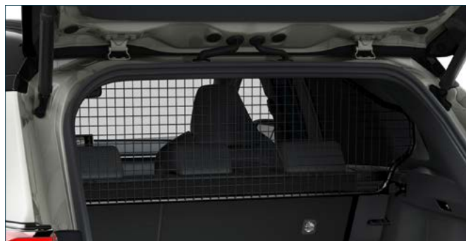
Trenngitter Art. Nr. 99002-53Z00-003