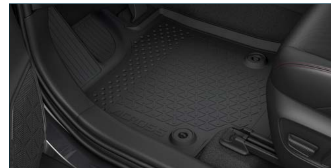
Gummitteppichsatz 4-teilig Art. Nr. 99002-53Z00-004

Die abgebildeten Zubehörteile sind nur eine kleine Auswahl aus dem umfangreichen Sortiment.