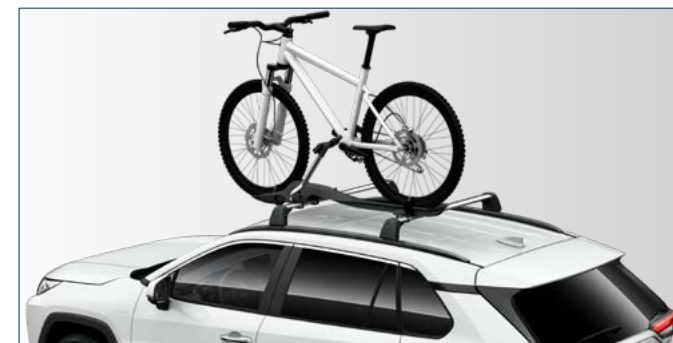
Dachfahrradträger «ProRide» Für Fahrräder bis 20 kg Art. Nr. Z1000-59800-000