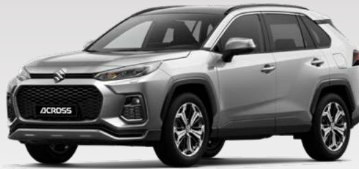
Silver Metallic (1D6)