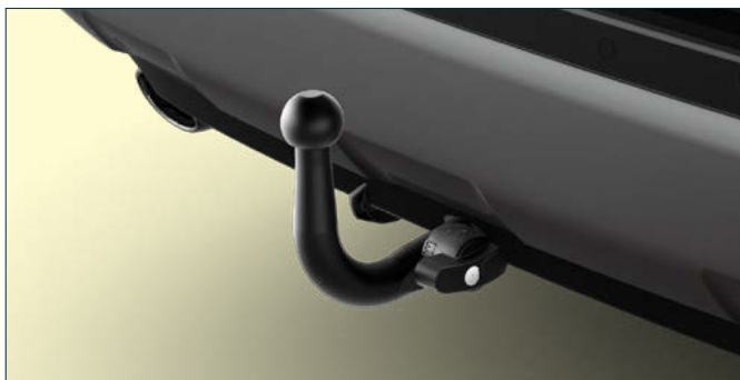
Anhängerkupplung abnehmbar Art. Nr. Z3000-66340-000 Art. Nr. Z3000-75420-300 Elektrosatz 7-polig Art. Nr. Z3000-75420-400 Elektrosatz 13-polig