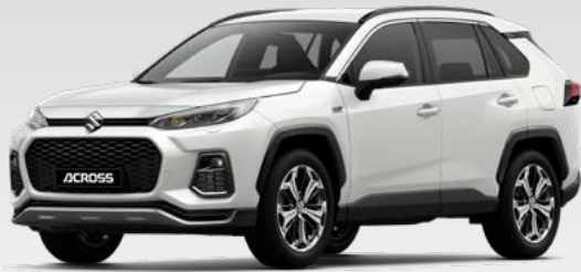
White Pearl Crystal Shine (070)*