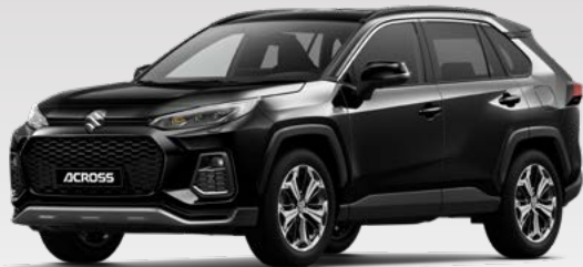
Attitude Black Mica (218)