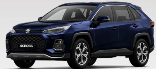
Dark Blue Mica (8X8)