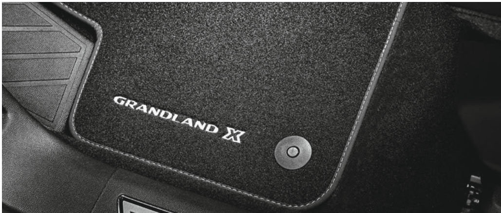
Autoteppiche, Velours, Schwarz Artikelnummer 1 680 227 980