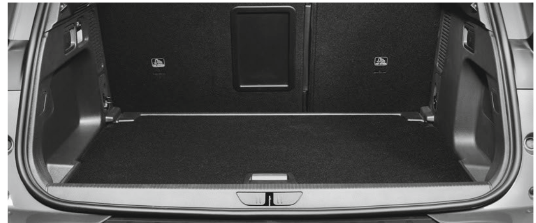
Laderaumteppich, Velours Artikelnummer 1 681 894 080