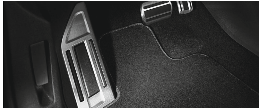
Fussstütze, Aluminium Artikelnummer 9 811 350 8VV