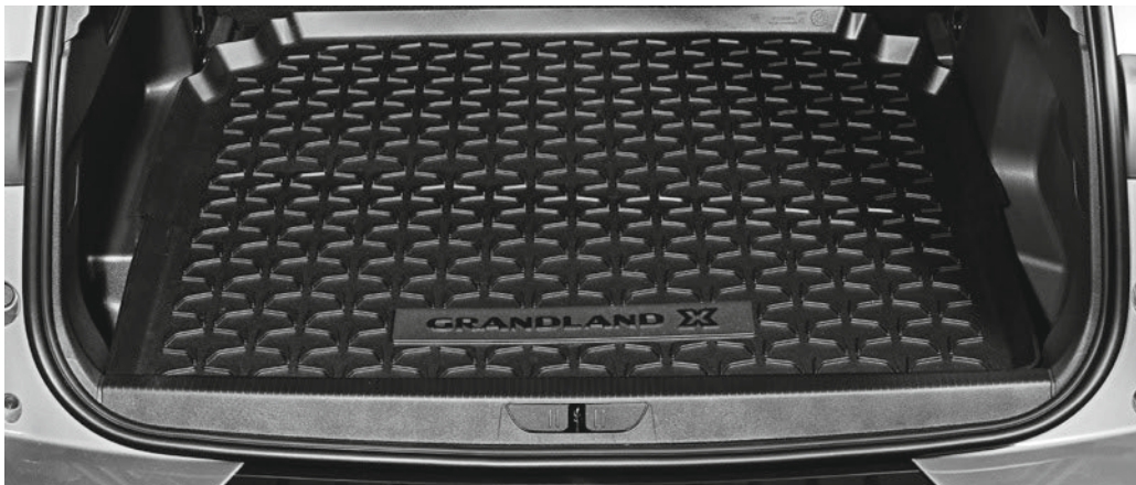
Laderaumschale Artikelnummer 1 681 894 280