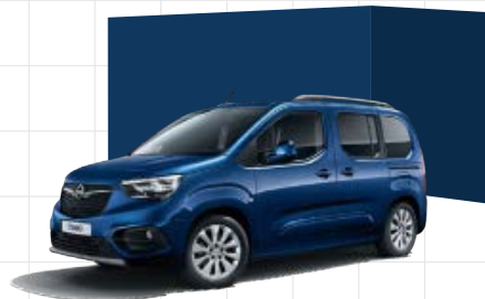
Night Blue 2