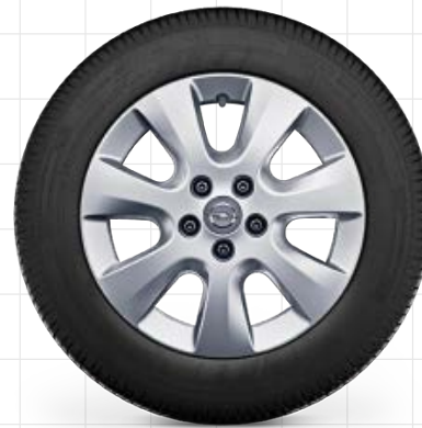
Leichtmetallfelge 6½ J x 16, 7 Speichen, Reifen 205/60 R16 2