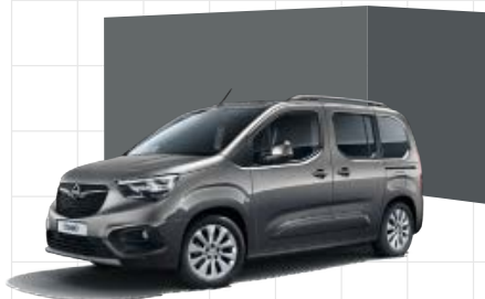
Moonstone Grey 2