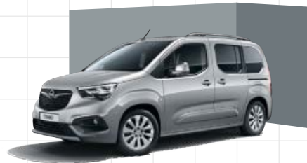
Quartz Grey 2