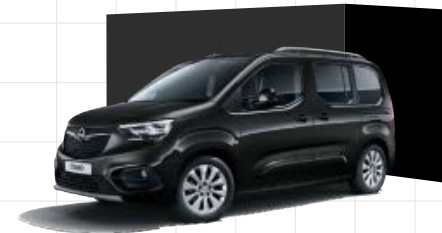
Onyx Black 1