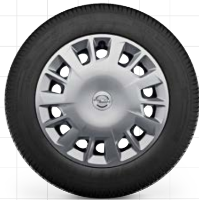
Stahlfelge 6½ J x 16 inkl. Abdeckung, Reifen 205/60 R16 1