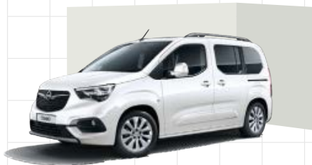
White Jade 1