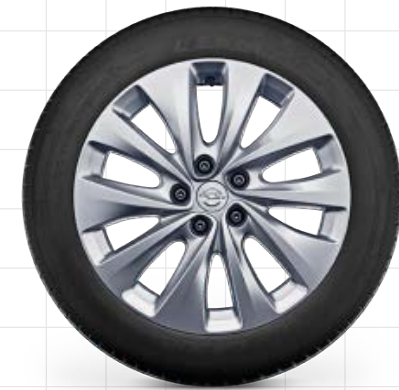
Leichtmetallfelge 7 J x 17, 10 Speichen, Reifen 205/55 R17 3