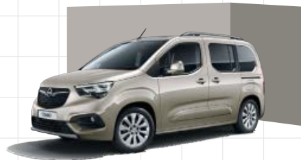
Cool Grey 2