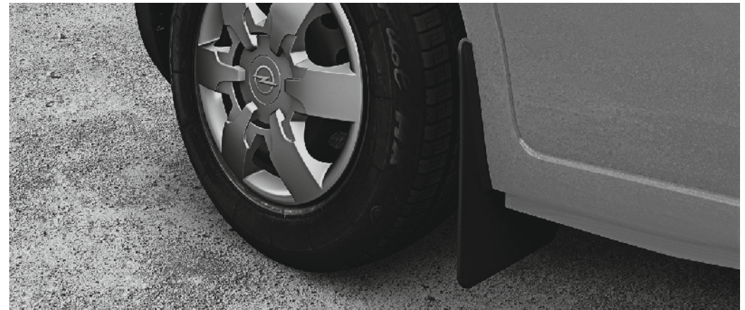
Satz mit 2 Schmutzfängern (vorn)