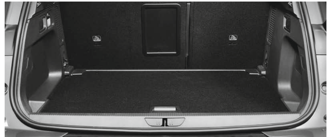
Laderaumteppich, Velours Artikelnummer 1 681 894 080