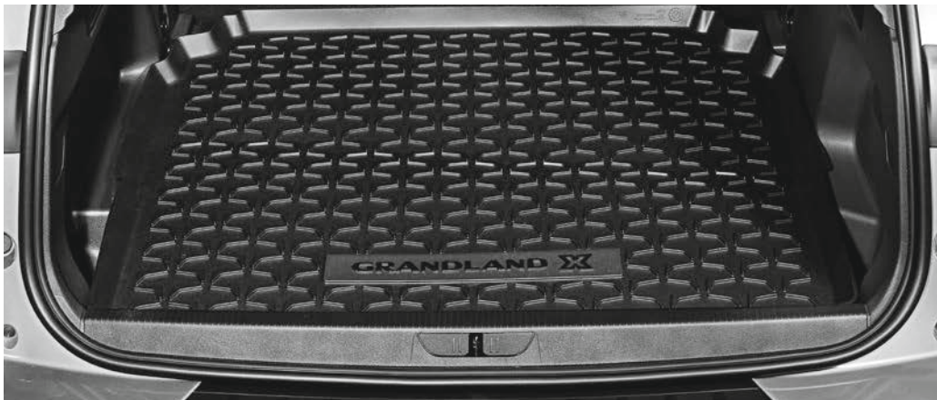
Laderaumschale Artikelnummer 1 681 894 280