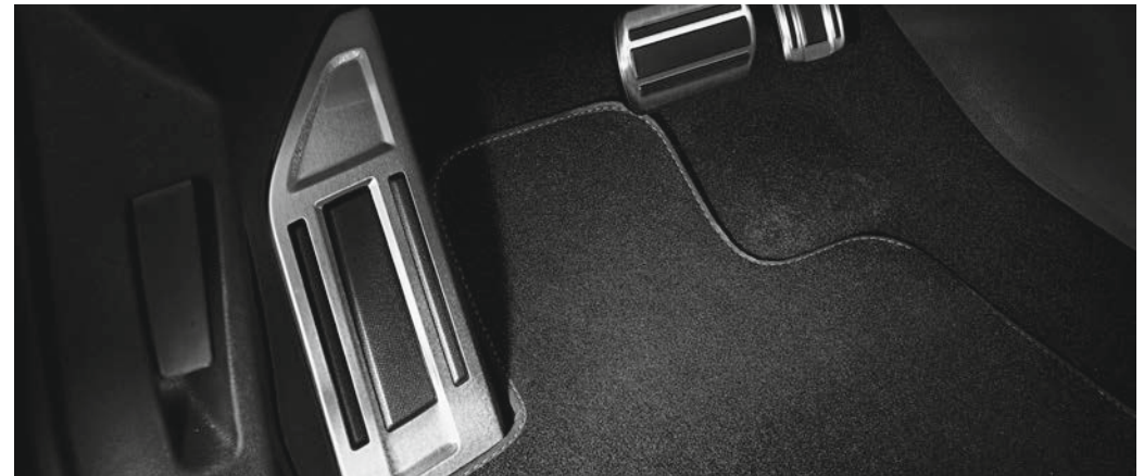
Fussstütze, Aluminium Artikelnummer 9 811 350 8VV