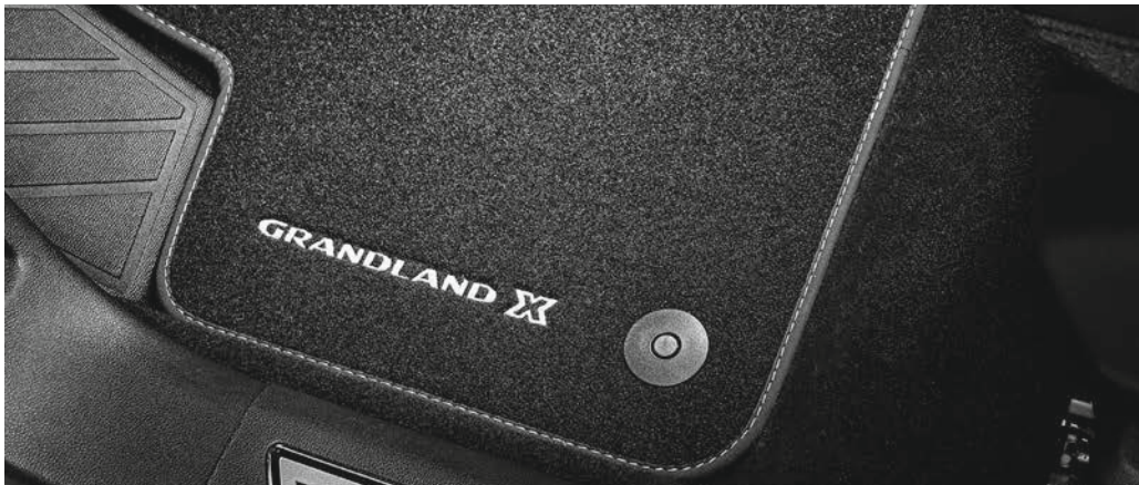
Autoteppiche, Velours, Schwarz Artikelnummer 1 680 227 980