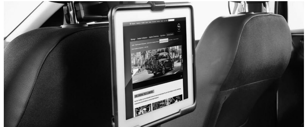
FlexConnect Trägersystem für iPad bzw. iPad mini

Der Basisträger muss separat bestellt werden.