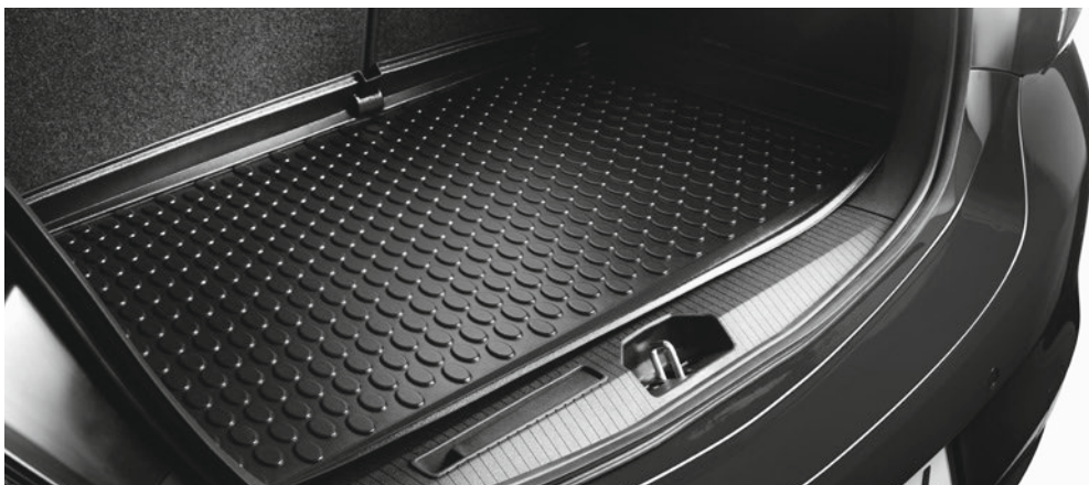
Rutschfeste Laderaumschale Artikelnummer 93 199 292