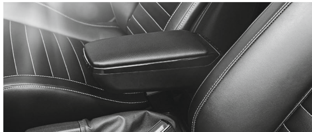
Mittelarmlehne, Schwarz Artikelnummer 39 046 848