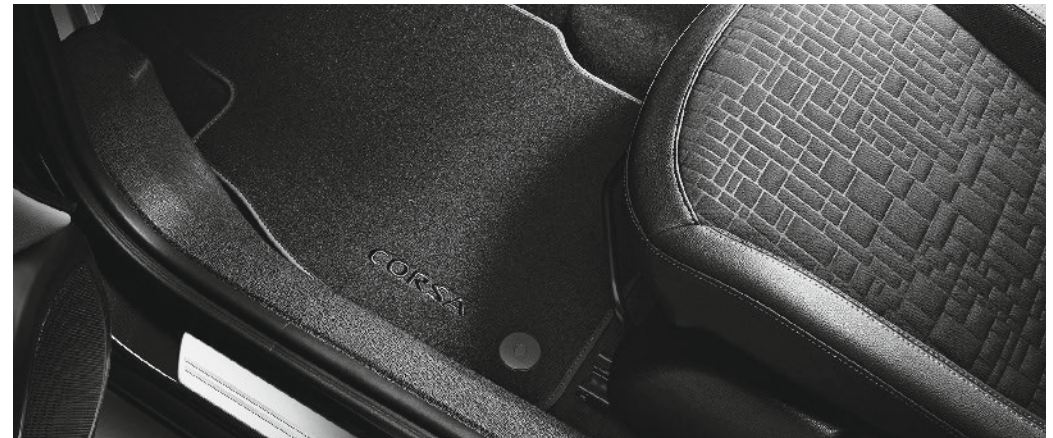
Fussmattensatz, Velours, 4-teilig Schwarz mit Umrandung und Logo in Rot Artikelnummer 13 440 226