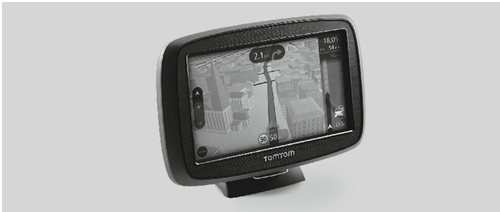
TomTom GO 40 Navigationssystem, inkl. TomTom Halterung zur Montage auf der FlexDock® Basis Nur in Verbindung mit FlexDock® Basisplatte verwendbar. Artikelnummer 39 021 599