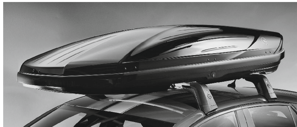
Opel Dachbox X Artikelnummer 1 662 444 480