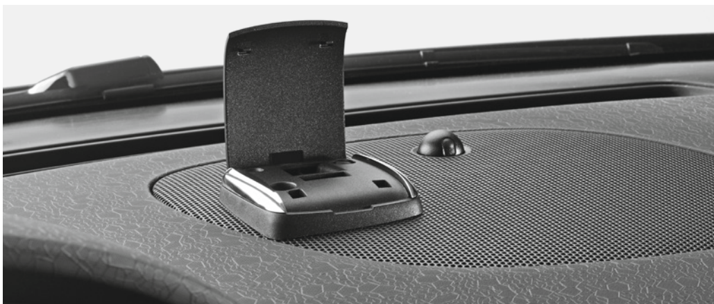
FlexDock® Halterung mit USB-Verbindung Artikelnummer 39 021 608